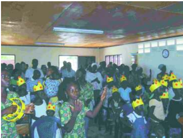
■ Templo lotado na inauguração

quase desapareceu por completo, devido a falta de obreiros, divisões, lutas e dificuldades.