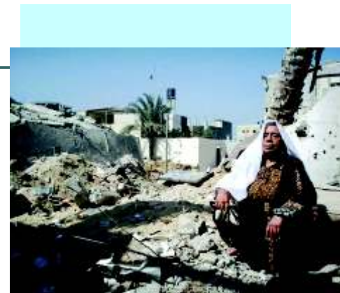
■ Destruição e tristeza em Gaza

Mesmo em meio a tensão causada pelo clima de guerra, os missionários acreditam que, através da intercessão, é possível mover a mão de Deus para que Ele intervenha na crise. "Não aguentamos ver tanto sofrimento, gente inocente morrendo. Sobretudo as crianças, que são o alvo do nosso ministério! Algo tem de ser feito. E a única coisa que vem à nossa mente é clamarmos a Deus para que intervenha nisso tudo, agindo à Sua maneira. Cremos que isso acontecerá!", finalizam.